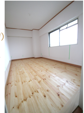
写真はイメージです。窓はありません。